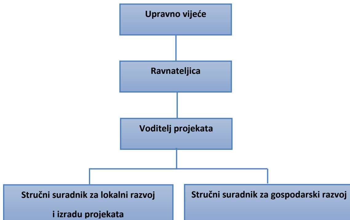
Grafikon 1: Organizacijska struktura